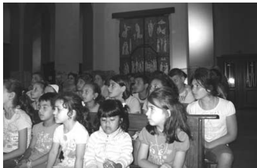
Giornata per i bambini

15 agosto: in occasione della festa dell'Assunta, centinaia di pellegrini hanno partecipato alla processione sul colle della Croce. Ha fatto seguito la Santa Messa, celebrata dal nostro Vescovo di Alba, Mons. Giacomo Lanzetti, che ci ha offerto un'omelia ricca del suo amore alla Madre della Divina Grazia.