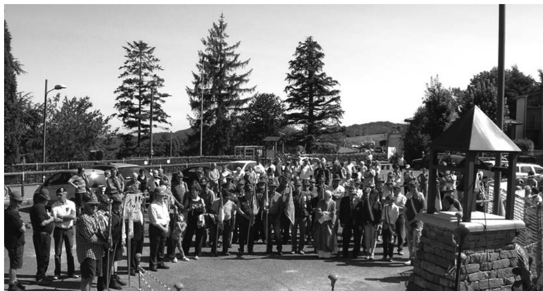
Pellegrinaggio degli Alpini