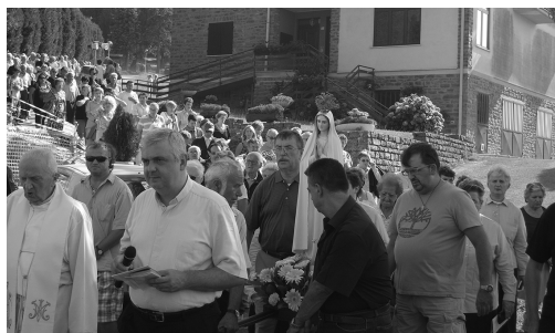
Processione al Colle della Croce in occasione della festa di Maria Vergine Assunta in Cielo