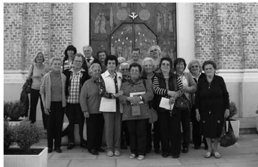
Pellegrinaggio da Neive

9 settembre: Raduno degli “Amici di Medjugorje” del Piemonte e Liguria.