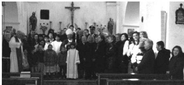
Foto di gruppo con i parrocchiani