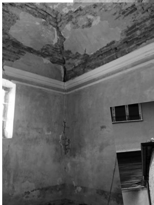
Volta ed esterno della Sacrestia di Gorrino