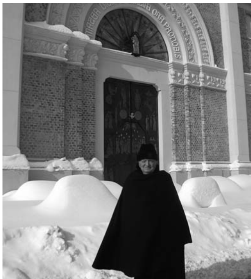
Neve al Todocco

Quest'anno è arrivata all'inizio di febbraio 2012: uno spettacolo assistere a una bufera durata due giorni, un candore assoluto ci ha offerto il Signore, in vista della Santa Pasqua; il termometro, per buona parte del mese, è sceso a meno 12°, il manto nevoso era ormai a un metro di altezza, ma non siamo rimasti isolati, grazie al lavoro di cari amici.